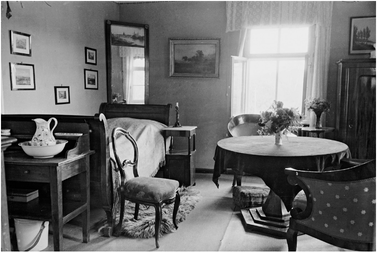
1 Sterbezimmer von Käthe Kollwitz im Rüdendorf, Moritzburg, 1945