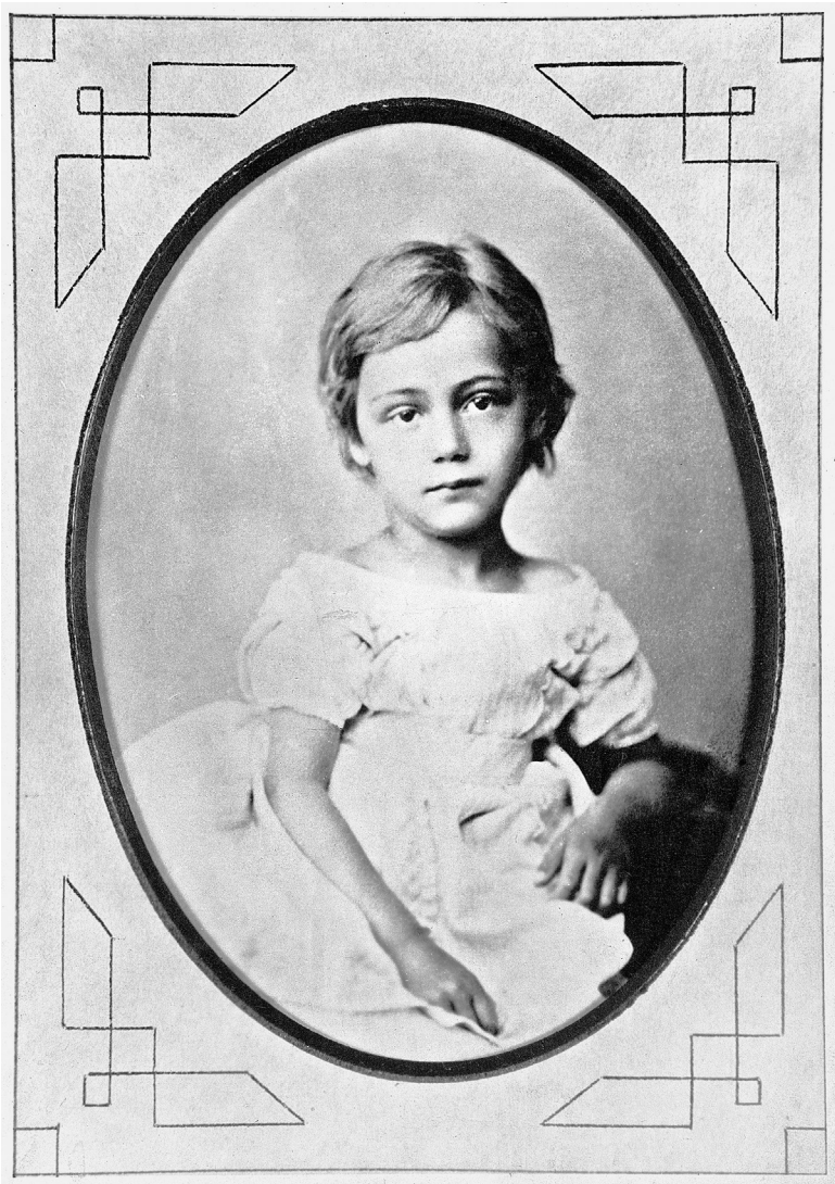
2 Käthe Kollwitz mit fünf Jahren